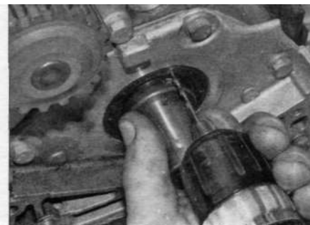
Рис. 14.4,а. Просверлите небольшое отверстие в манжете

4 Отверткой аккуратно извлеките манжету из гнезда. Не повредите поверхность гнезда и вала. Вы можете также просверлить в манжете небольшое отверстие (не повредив поверхность гнезда), ввернуть в него саморез и, ухватившись за его головку, извлечь манжету [рис. 14.4,а,б).