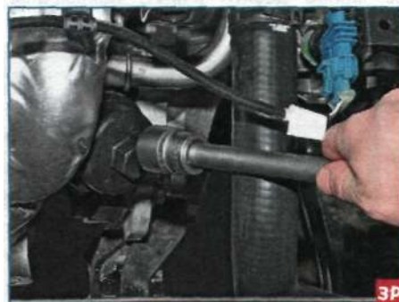
Головкой «на 24» ослабляем затяжку крышки масляного фильтра.

Протерев пробку, заворачиваем и затягиваем ее. Удаляем потеки масла с поддона картера двигателя. Подставляем емкость под масляный фильтр.