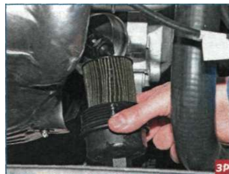
Отвернув, снимаем крышку с масляным фильтром.