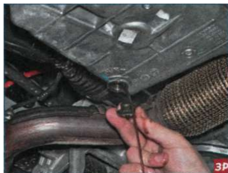
Отвернув пробку вручную, сливаем масло.

Подставляем под сливное отверстие широкую емкость для отработанного масла объемом не менее 5,0 л.