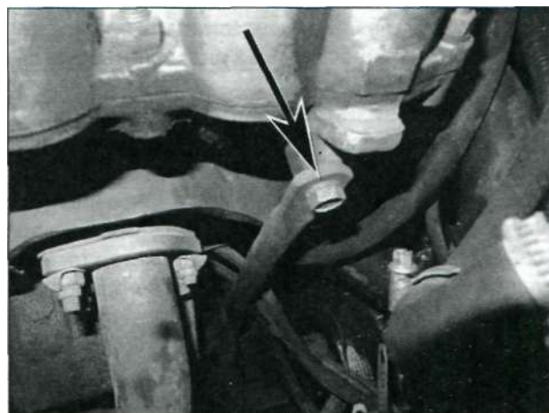
Выверните верхний болт крепления кронштейна {указан стрелкой}...

Проследите ещё раз, все ли отсоединено и отведено в сторону, что может помешать снятию ГБЦ.