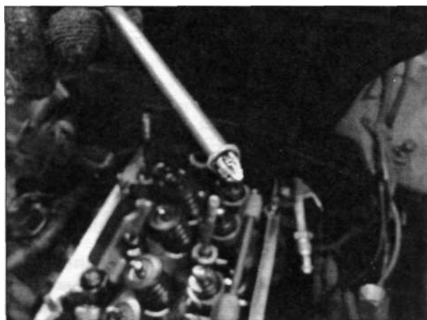
и снять его

• Отвернув крестовой отвёрткой винты крепления прижимных^коб топливных трубок, отсоедините их от клапанной крышки.