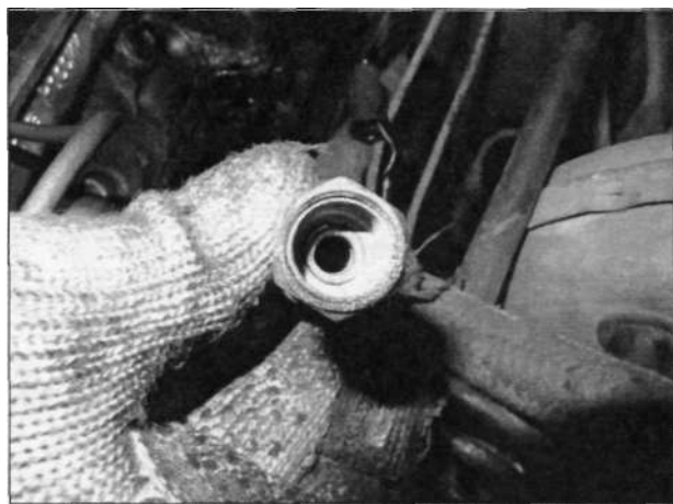
Уплотнительное кольцо нужно поддеть отвёрткой...