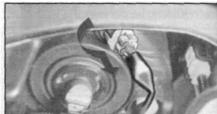
Лампа стояночного огня.

2. Выньте лампу из разъема. 3. Вставьте новую лампу в разъем и установите его на место в последовательности, обратной снятию.