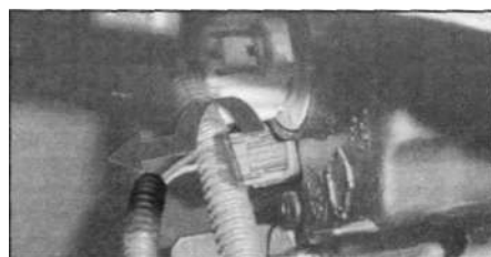
Лампа переднего габарита.

1. Поверните разъем необходимой лампы против часовой стрелки и вытащите лампу из блока фары, как показано на рисунке.