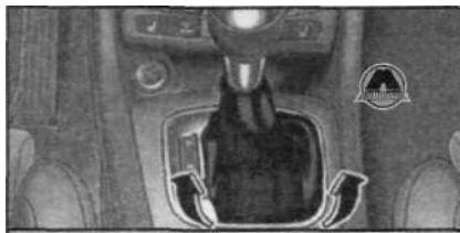
Рычаг переключения передач: снятие крышки

Для буксировки автомобиля при выходе из строя электропитания нужно произвести аварийную разблокировку рычага селектора.