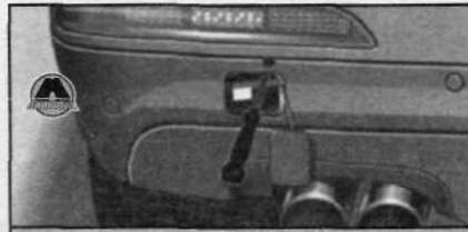
Модуль фонарей в бампере: винт крепления