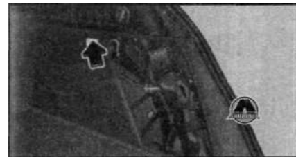
Боковая обшивка справа в багажнике: устройство аварийной разблокировки

При неисправной системе замков с центральным управлением крышку заправочного люка можно открыть вручную.