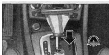
Рычаг селектора: аварийная разблокировка

Разблокировка требует специальных навыков. Поэтому при необходимости рекомендуется обратиться за помощью.