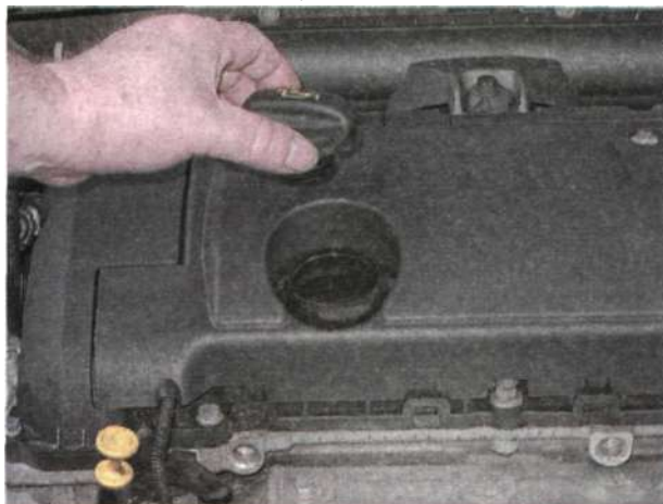
двигатель EP6DT .