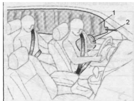
1 - шторка безопасности, 2 - боковая подушка безопасности.

Водителю и впереди сидящему пассажиру следует помнить, что если они не будут надлежащим образом пристегнуты ремнями безопасности, то при срабатывании подушки безопасности они могут быть серьезно травмированы, причем не исключена возможность смертельного исхода. При неожиданном торможении перед столкновением водитель или впереди сидящий пассажир, не пристегнутый надлежащим образом ремнем безопасности, может податься вперед близко к подушке безопасности, кото-