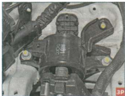
Вид на левую опору.