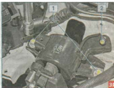
Головкой «на 14» отворачиваем два болта 1 и гайку 2 крепления левой опоры к кузову...