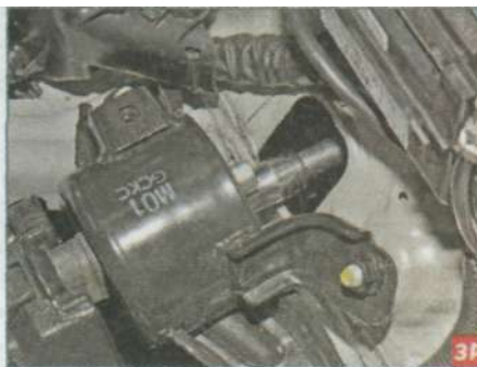
...головкой «на 14» с удлинителем отворачиваем два болта крепления опоры к кронштейну...