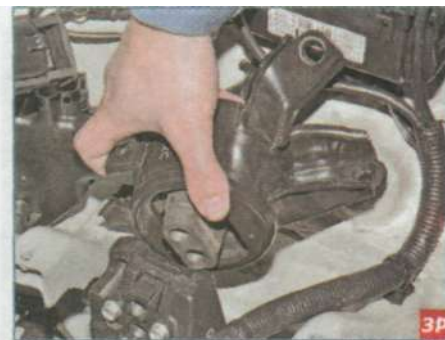
...и снимаем опору.