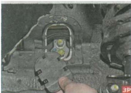
Сжав фиксаторы заглушки, вынимаем ее из отверстия брызговика.

Устанавливаем левую опору силового агрегата в обратной последовательности.