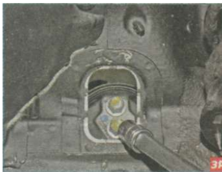
Через отверстие в брызговике.

Вывешиваем и снимаем левое переднее колесо. Устанавливаем через деревянный брусок надежную опору под картер коробки передач. Снимаем площадку аккумуляторной батареи (см. «Снятие блока ABS», с. 186).