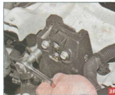
...головкой «на 10» отворачиваем два болта крепления к кронштейну стопорной пластины гаек.