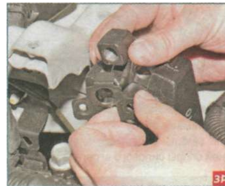
Снимаем стопорную пластину и вынимаем из паза кронштейна две закладные гайки болтов крепления опоры.

Устанавливаем левую опору силового агрегата в обратной последовательности.