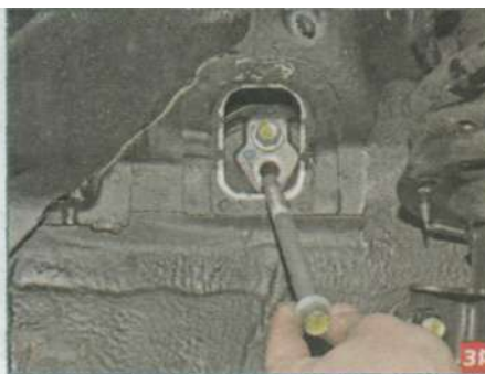
...и вынимаем болты.