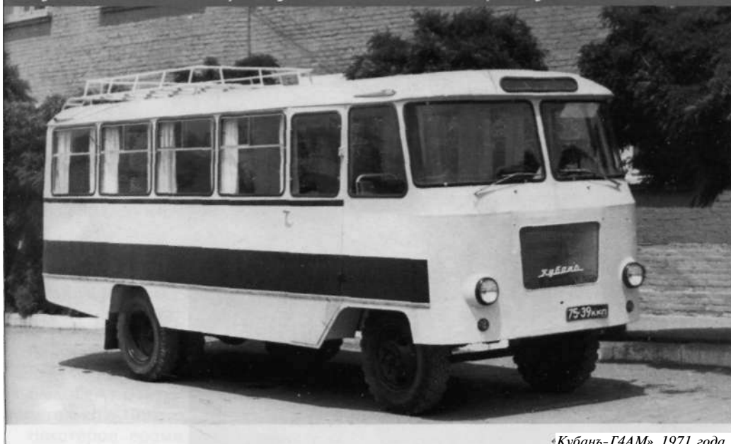
«Кубань-Г4АМ» 1971 года