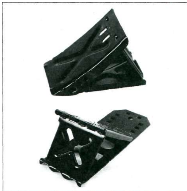
Складные противоткатные упоры