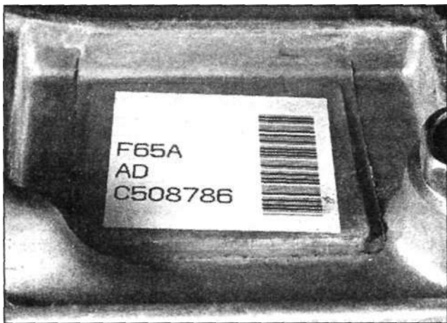
Наклейка с номером механической коробки передач прикреплена к кожуху коробки со стороны пассажира