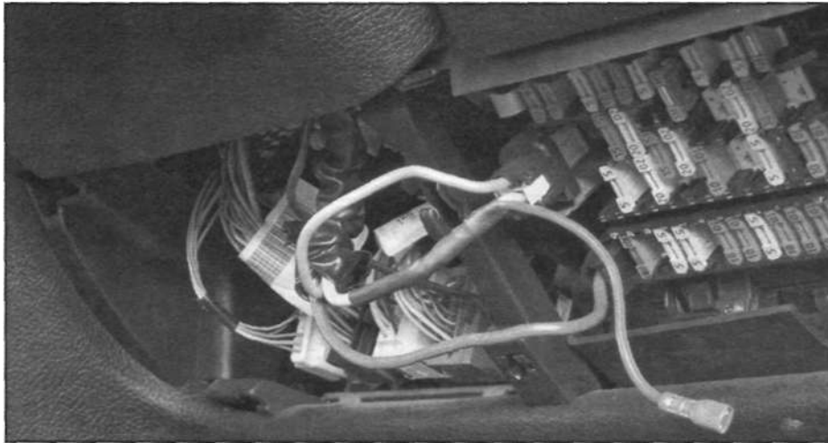
Аккуратно припаяйте провода к свободному источнику 12 V для электрического обеспечения NOS.