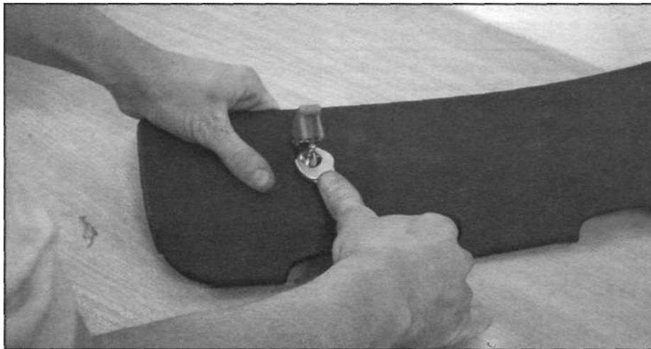
Снимите подходящую панель, просверлите отверстие и установите "главную кнопку" (главный активатор).