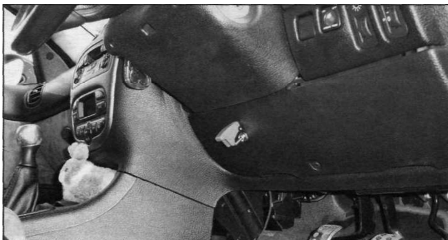
Главный выключатель, установленный в непосредственной близости от водителя.