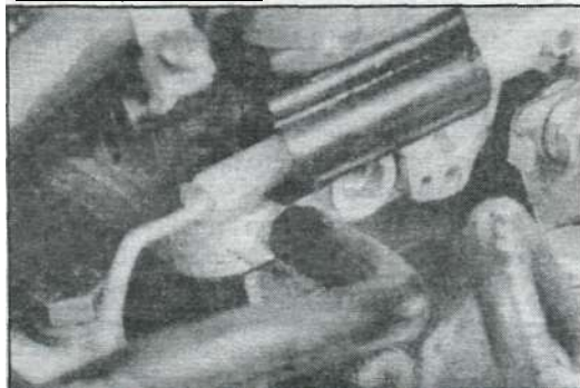
Провод автоматического устройства защиты от переливания - карбюратор Weber 30/32 DMTE.