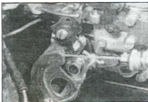
Присоединение троса дроссельной заслонки - карбюратор Weber 30/32 DMTE.