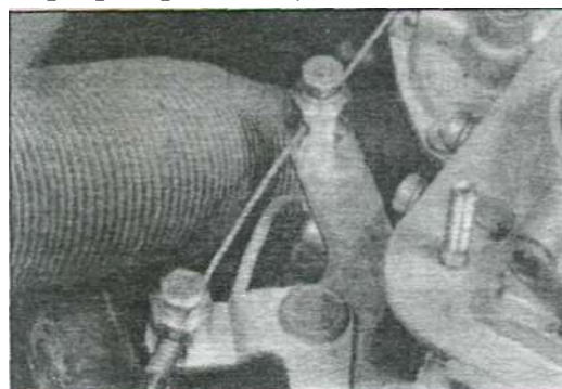
Присоединение троса воздушной заслонки - карбюратор Weber 30/32 DMTE.