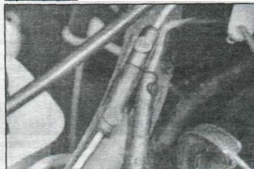
Соединения проводов - карбюратор Weber 30/32 DMTE.