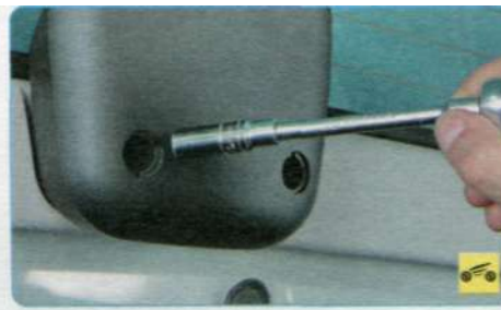
4. Выверните два болта крепления дополнительного стоп-сигнала к двери задка...