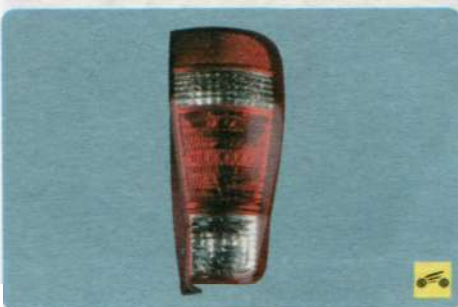
9. Установите задний фонарь в порядке, обратном снятию.