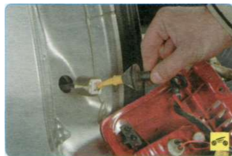
6. ...извлеките жгут вместе с уплотнителем из отверстия в кузове до момента появления соединительной колодки.