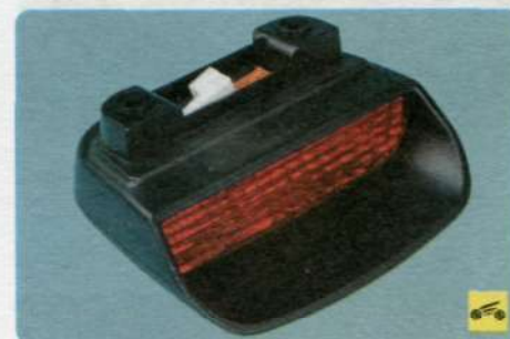
8. Установите дополнительный стоп-сигнал и все снятые детали в порядке, обратном снятию.