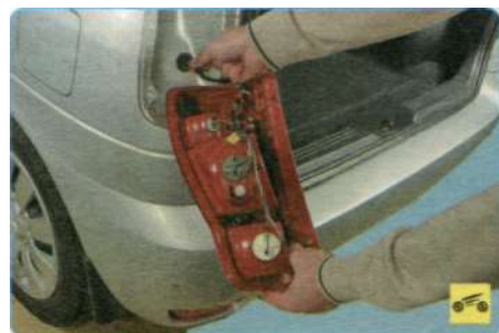
5. Потянув за жгут проводов заднего фонаря...