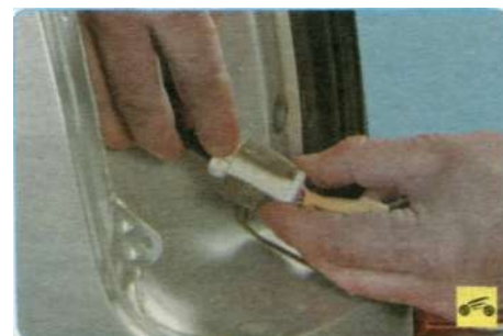
7. Нажмите на фиксатор колодки жгута проводов...