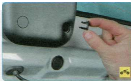
3. ...и снимите заглушку. Аналогично снимите вторую заглушку.