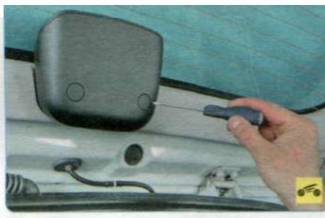
2. Подденьте отверткой край декоративной заглушки болта крепления дополнительного стоп-сигнала...

1. Отсоедините провод от клеммы «минус» аккумуляторной батареи,