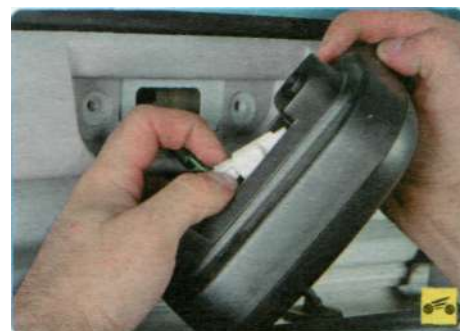
6. Нажмите на фиксатор колодки жгута проводов...