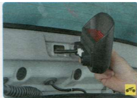
5. ...и отсоедините стоп-сигнал от двери.