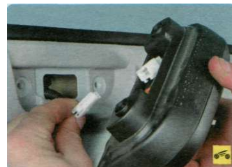
7. ...разъедините колодку и снимите дополнительный стоп-сигнал.