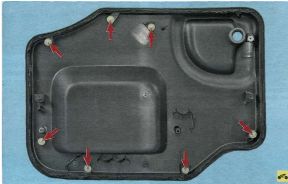
Рис. 11.6. Расположение фиксаторов крепления обивки левой аворки двери задка (вид с внутренней стороны)

Вам потребуются: ключ TORX T20, отвертка с плоским лезвием, нож.