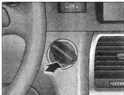
Ключ в замке зажигания

Если Вы не можете извлечь ключ из замка зажигания, например, вследствие разряда АКБ а/м, необходимо следующее. Поверните ключ зажигания в положение 0. Шариковой ручкой или похожим предметом нажмите кнопку аварийного отпирания и удерживайте ее нажатой. Извлеките ключ зажигания.