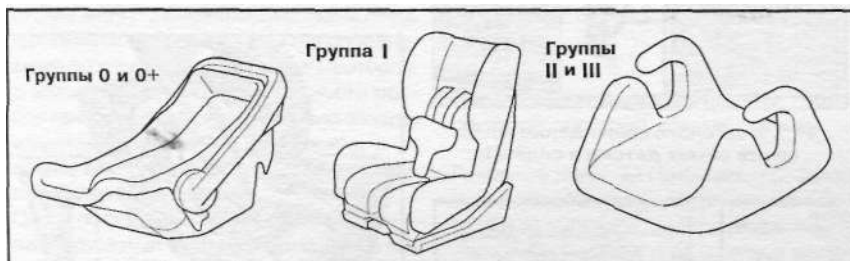
13.1 Примеры конструкции детских кресел по весовым группам по стандарту ECE R44