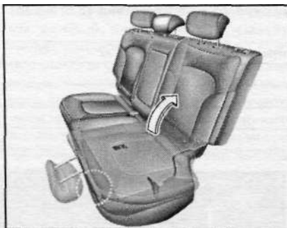
12.14 Установка секции спинки заднего сиденья - проверьте отсутствие красной метки на рычаге отпущения фиксатора (выделено)