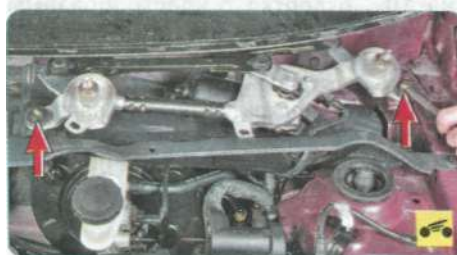
5. Выверните два болта крепления

4. Отожмите фиксатор и отсоедините колодку жгута проводов от моторедуктора очистителя ветрового окна.