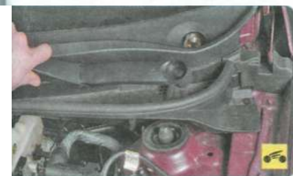
2. Снимите рычаги стеклоочистителя (см. «Установка и установка рычагов стеклоочистителя ветрового окна», с. 259).

1. Отсоедините провод от клеммы «минус» аккумуляторной батареи.