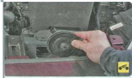
7. ...и снимите звуковой сигнал.