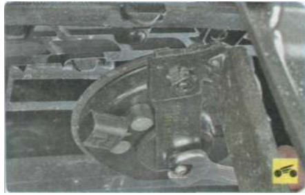
6. Отверните гайку крепления звукового сигнала к кронштейну...