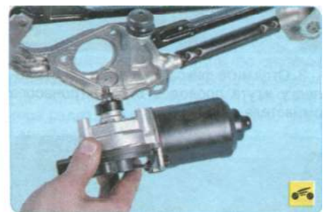
10. ...и снимите моторедуктор.