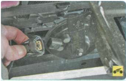
5. Отожмите фиксатор и отсоедините колодку жгута проводов от звукового сигнала.