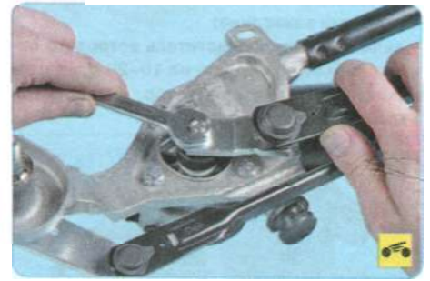
7. Отверните гайку крепления кривошипа.

6. ...и снимите трапецию стеклоочистителя.