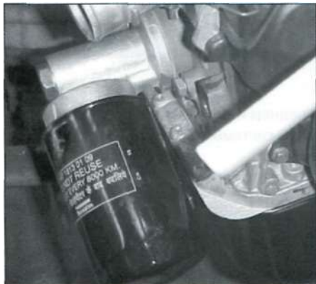
Масляный фильтр двигателя